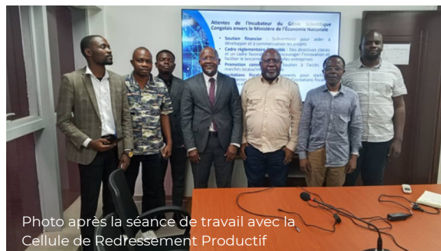
Photo après la séance de travail avec la Cellule de Redressement Productif