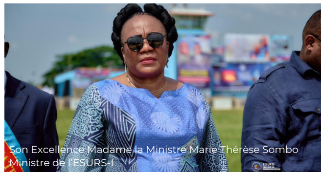
Son Excellence Madame la Ministre Marie Thérèse Sombo Ministre de l'ESURS-I

Cette collaboration ambitionne de renforcer les capacités nationales en matière de conception et de déploiement de solutions technologiques locales adaptées aux réalités sanitaires du pays. Les discussions ont porté sur la structuration des projets innovants, la mutualisation des expertises techniques et la création de mécanismes favorables à la consommation locale des innovations issues de la recherche congolaise.