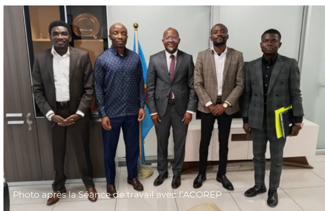
Photo après la Séance de travail avec l'ACOREP